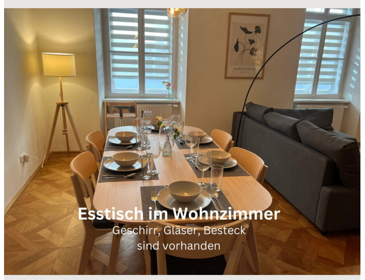
Esstisch im Wohnzimmer Geschirr, Gläser, Besteck sind vorhanden