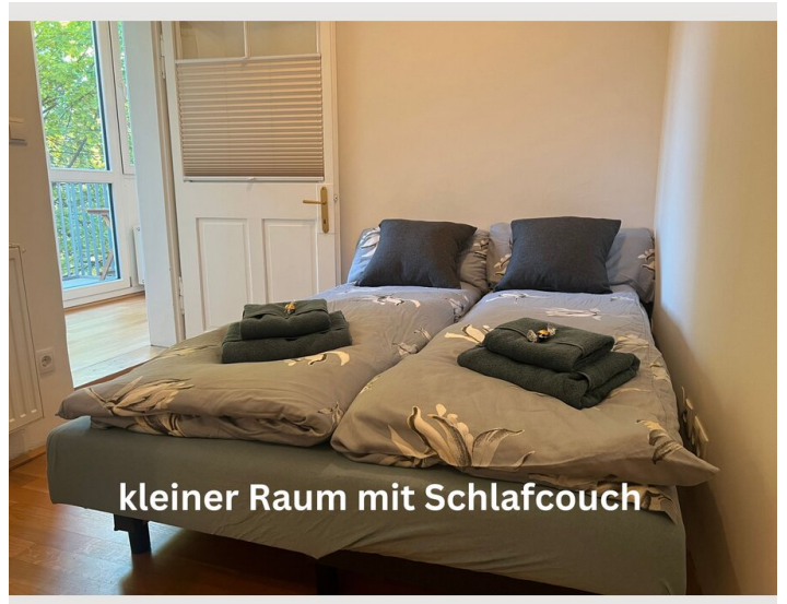
kleiner Raum mit Schlafcouch