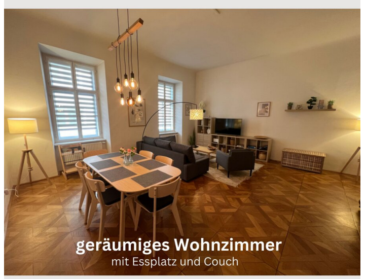
geräumiges Wohnzimmer mit Essplatz und Couch