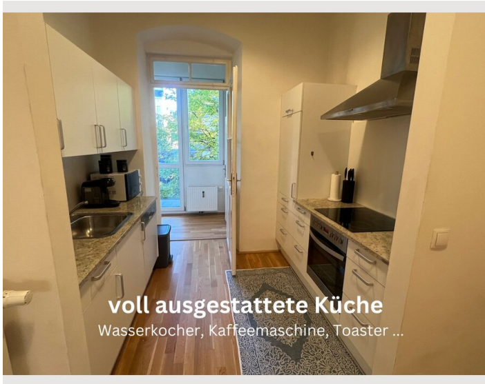
voll ausgestattete Küche Wasserkocher, Kaffeemaschine, Toaster ...