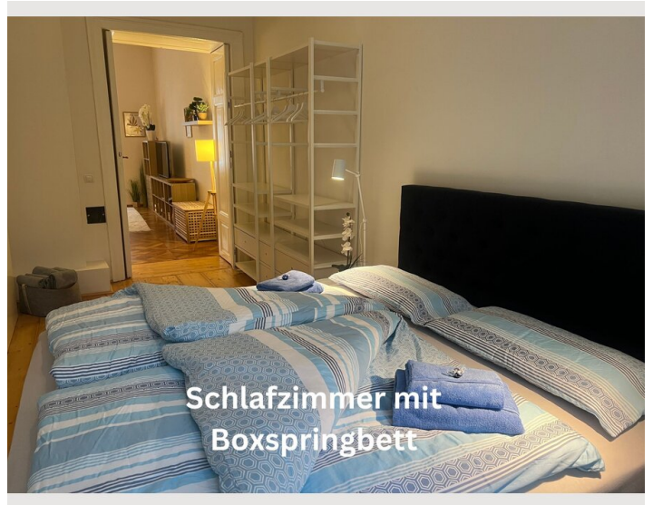
Schlafzimmer mit Boxspringbett