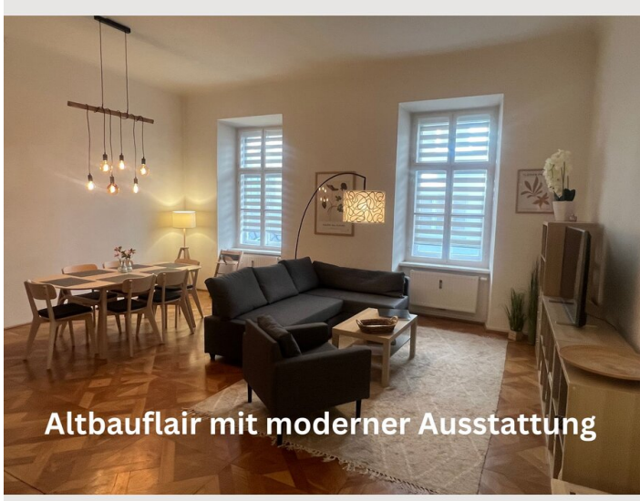
Altbaufair mit moderner Ausstattung