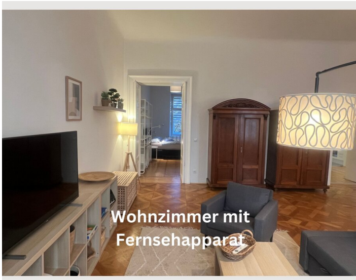
Wohnzimmer mit Fernsehapparat