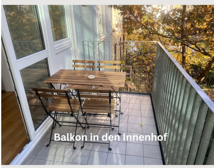
Balkon in den Innenhof