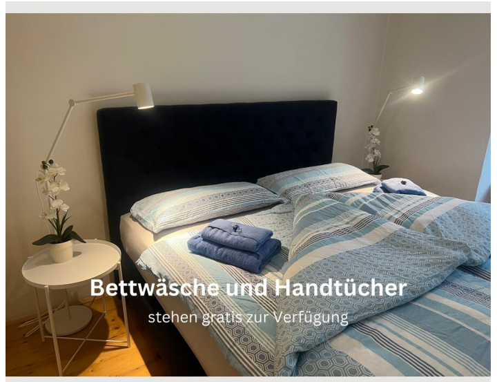
Bettwäsche und Handtücher stehen gratis zur Verfügung