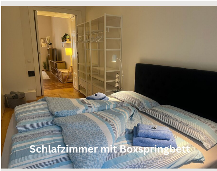
Schlafzimmer mit Boxspringbett