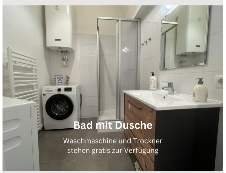
Bad mit Dusche Waschmaschine und Trockner stehen gratis zur Verfügung