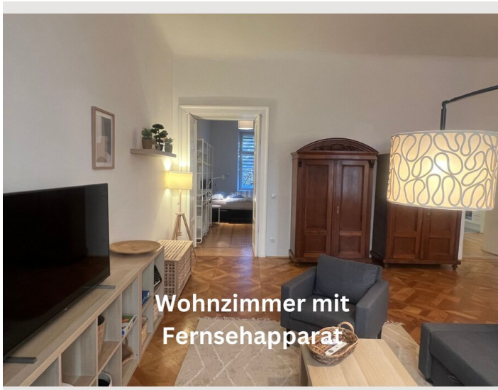
Wohnzimmer mit Fernsehapparat

Geschirr, Gläser, Besteck sind vorhanden